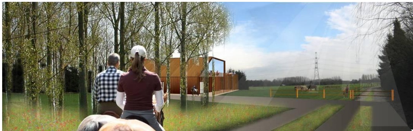
figuur 5: visualisatie van het mogelijk zicht op de overdekte ruiterpiste

Indien de ruitersactiviteiten op termijn toch zouden verdwijnen is de nabestemming van alle delen van deze zone uitsluitend landbouw